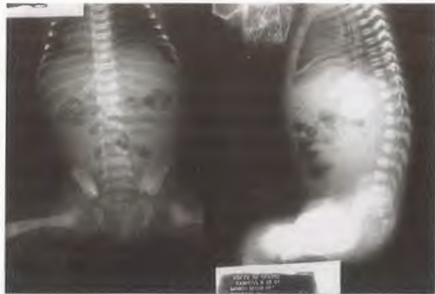
Figura 2. Estudio radiológico simple de abdomen en dos incidencias y posición vertical que muestra el menisco clásico del aire libre subdiafragmático producto de la perforación intestinal que sufría el paciente.

datos sugestivos de perforación. De estos, dos tenían aire libre subdiafragmático (Figura 2). Anomalías asociadas: Un paciente tuvo ano imperforado, uno hipospadias y otro, trisomía 21. Hallazgos operatorios: Todos tenían necrosis del intestino delgado (Figura 3) de longitud distinta y malrotación intestinal. El defecto fue falta de rotación del segmento duodenoyeyunal con rotación incompleta del segmento ileo-cólico (Figura 4) en ocho y en el resto, falta de rotación del segmento ileo-cólico con rotación normal del segmento duodenoyeyunal. Cuatro sufrieron perforación en las áreas de la necrosis. Tratamiento quirúrgico. En cinco pacientes se realizó resección y