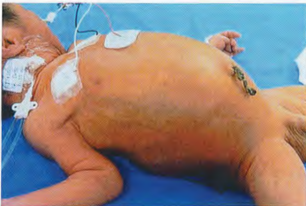
Figura 1. Panorámica de un paciente recién nacido que sufre volvulus perinatal del intestino medio como complicación de malrotación intestinal.

Hubo diez pacientes, siete fueron del sexo masculino. La edad postnatal fue de tres días o menos, en ocho; más de tres días en dos. Ninguno más de una semana de vida extrauterina. El diagnóstico de referencia en 7 fue enterocolitis necrosante; síndrome de oclusión intestinal de origen no precisado en tres. El tiempo de evolución desde el ingreso hasta el momento de la operación fue de 24 horas en cinco casos; 48 horas en tres, y más de 72 horas en dos. La sintomatología más frecuente fue vómito biliar y distensión abdominal en todos (Figura 1). Radiológicamente, seis mostraron datos de oclusión intestinal y tres,