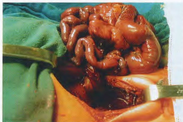
Figura 3. Momento transoperatorio que revela mediante un acercamiento visual, la torsión que sufre la arteria mesentérica superior y las consecuencias macroscópicamente visibles. Existen áreas de isquemia extensas. En este caso hubo pérdida extensa de intestino delgado.

datos sugestivos de perforación. De estos, dos tenían aire libre subdiafragmático (Figura 2). Anomalías asociadas: Un paciente tuvo ano imperforado, uno hipospadias y otro, trisomía 21. Hallazgos operatorios: Todos tenían necrosis del intestino delgado (Figura 3) de longitud distinta y malrotación intestinal. El defecto fue falta de rotación del segmento duodenoyeyunal con rotación incompleta del segmento ileo-cólico (Figura 4) en ocho y en el resto, falta de rotación del segmento ileo-cólico con rotación normal del segmento duodenoyeyunal. Cuatro sufrieron perforación en las áreas de la necrosis. Tratamiento quirúrgico. En cinco pacientes se realizó resección y