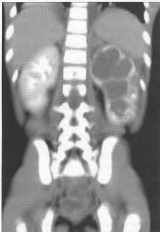
Figura 2. La Reconstrucción mediante tomografía axial que muestra dilatación de la pelvis renal izquierda y extravasación del medio de contraste en la periferia de la víscera.

Después de haber recibido el golpe, el niño fue llevado a hospital materno-infantil donde lo encontraron en regular estado general y pálido. Al llegar a nuestro servicio, lo encontramos en malas condiciones generales, con tensión arterial normal, pero con indicios de que había perdido sangre, pues su cifra de hemoglobina era 1.5 gramos menos del normal esperado. El abdomen estaba rígido; no había movimientos intestinales. Se quejaba de dolor en el hipocondrio y el flanco izquierdos. Se supuso que sufría rotura de bazo y riñón de ese lado por lo que se solicitó una tomografía axial computarizada (Figura 2), que reveló