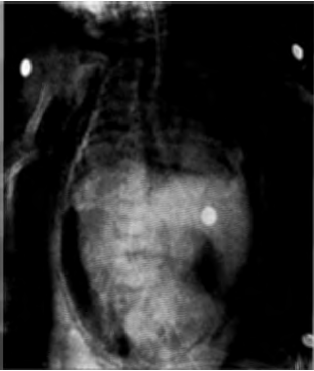
Figura 3. Radiografía toracoabdominal en la que se aprecian neumoperitoneo y enfisema subcutáneo.