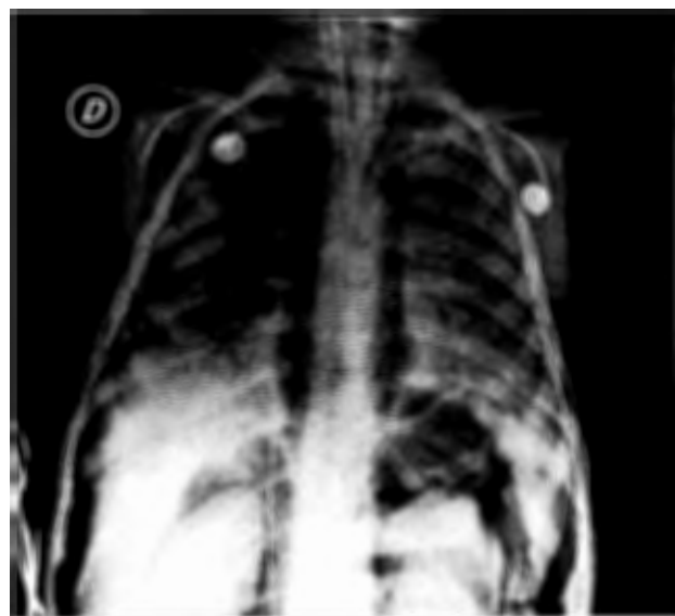
Figura 2. Radiografía que muestra neumomediastino, neumotórax y neumoperitoneo masivo.