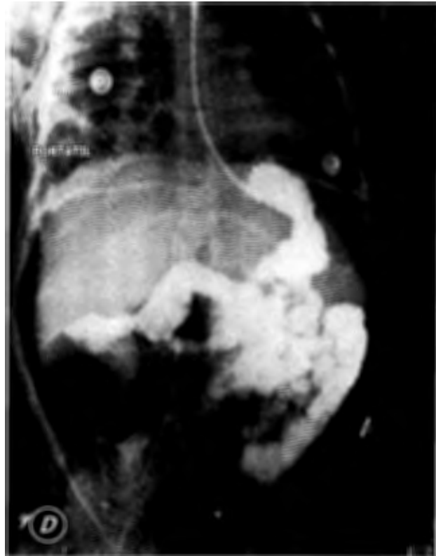
Figura 5. Imagen de tránsito intestinal en donde se descarta perforación de víscera hueca y se aprecia neumoperitoneo.

urgencia clínica es descartar una perforación intestinal. Se considera que la ventilación es la causa de neumoperitoneo cuando no existen antecedentes médicos como úlcera duodenal perforada, irritación peritoneal, enfisema