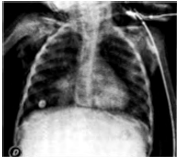
Figura 6. Radiografía de tórax que muestra proceso bronconeumónico, sonda pleural derecha con remisión del neumotórax y del neumoperitoneo.

subcutáneo; datos radiológicos que sugieran perforación de víscera hueca, como niveles hidroaéreos, falta de dis-