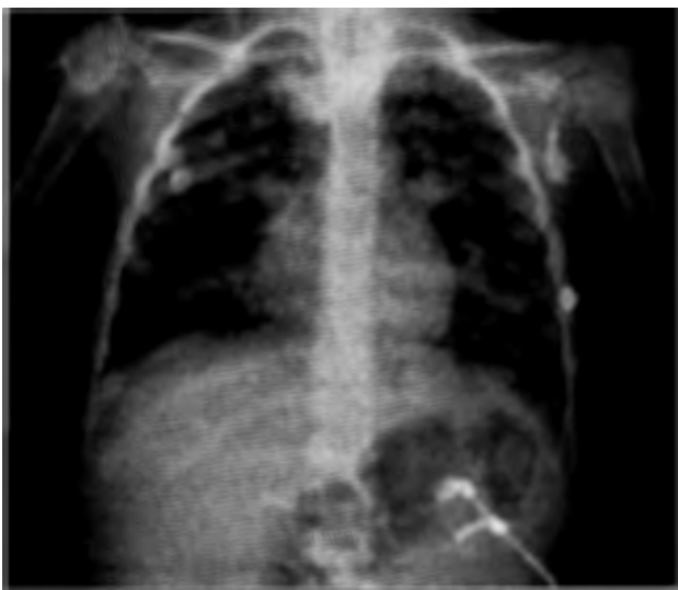
Figura 1. Radiografía de tórax inicial que muestra radiopacidad aumentada en ambos campos pulmonares indicativo de bronconeumonía.

CPM: Clicado por minuto, Peep: presión espiratoria máxima (pico) al final de la espiración, Pi: Presión inspiratoria, FiO 2 : Fracción inspirada de oxígeno, RX: Radiografía, DX: Diagnóstico