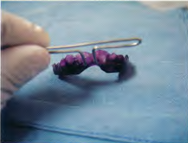
Figura 2. Vista clínica del aparato antes de la colocación.

de Inmunología, Dermatología, Cirugía, Oftalmología. En la interconsulta con el estomatólogo se comentó la probabilidad de fijar las cánulas y sondas mediante sujeción a los dientes o a la encía. Debido al riesgo de este tipo de fijación se propuso diseñar un dispositivo apoyado en la dentadura, una guarda oclusal de acrílico con un vástago metálico con proyección extraoral y que permitiera la fijación de las cánulas (Figuras 1, 2). Se sedó al paciente con midazolam.