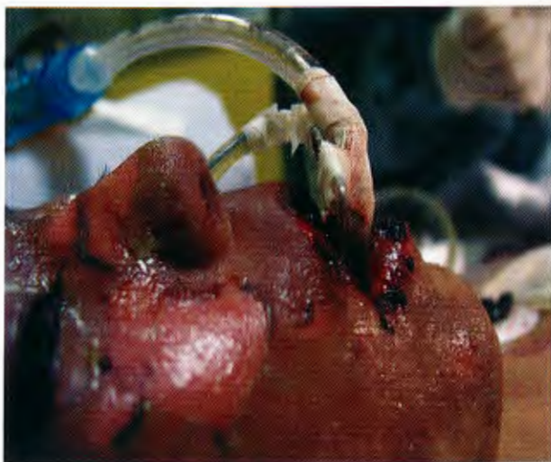
Figura 5. Vista lateral de las cánulas fijadas, nasogástrica, orotraqueal y orogástrica, sin tocar la piel y evitando su descamación.