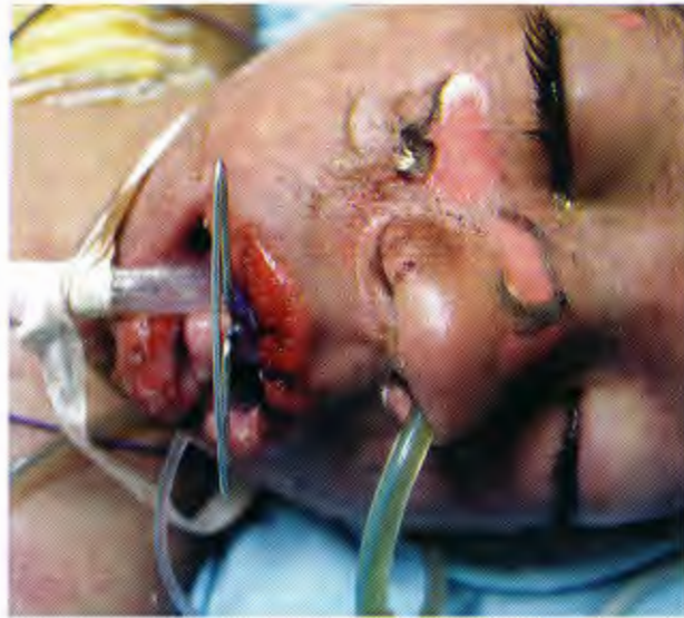
Figura 3. Fijación del aparato. Nótese la fijación poco eficiente que tiene alrededor del cuello.

En el quirófano y bajo anestesia general, se efectuó aseo quirúrgico, colocación de catéter y aseo de la cavidad bucal con agua estéril retirando costras y restos de alimentos. Cinco días después de la evolución satisfactoria del paciente, se extubó y se retiró el dispositivo intraoral para la fijación de cánulas. Al si-