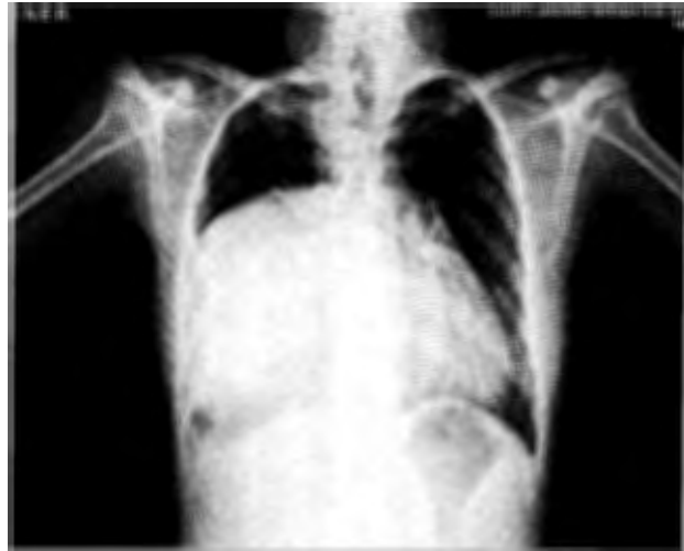
Figura 1. Radiografía PA de tórax de la paciente, que muestra radiopacidad homogénea en el hemitórax derecho proveniente de mediastino.

La tomografía de tórax contrastada, con ventana para mediastino, (que permite evaluar estructuras vasculares y ganglios) mostró una lesión en el mediastino medio; era redondeada, con bordes bien definidos; medía 12 x 17 cm de diámetro y se hallaba contigua a la arteria pulmonar. Su imagen era heterogénea: predominaba la densidad líquida y en su interior revelaba múltiples lesiones pequeñas, redondeadas, con la densidad de la grasa (Figura 2). En la ventana para parénquima se confirmó que la lesión era dependiente del mediastino. El parénquima pulmonar no mostró alteraciones. Para definir mejor el contenido líquido de la lesión se realizó ultrasonido de tórax y abdomen, donde se vio una masa de contornos bien definidos, de aspecto lobulado y contenido heterogéneo debida a múltiples imágenes redondeadas ecogénicas, bien definidas, sin vascularidad, similares a la grasa, la mayor de 30 mm. El Doppler color, mostró una imagen anecóica con ecos finos en su interior. El estudio de marcadores tumorales