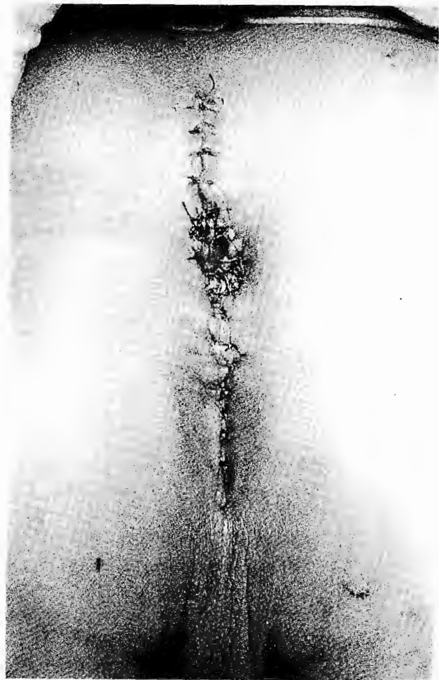
Figura 1 b

Se localizó el recto; se colocaron riendas para mantener una tensión simétrica de esta estructura durante su disección. El recto mostraba una dilatación