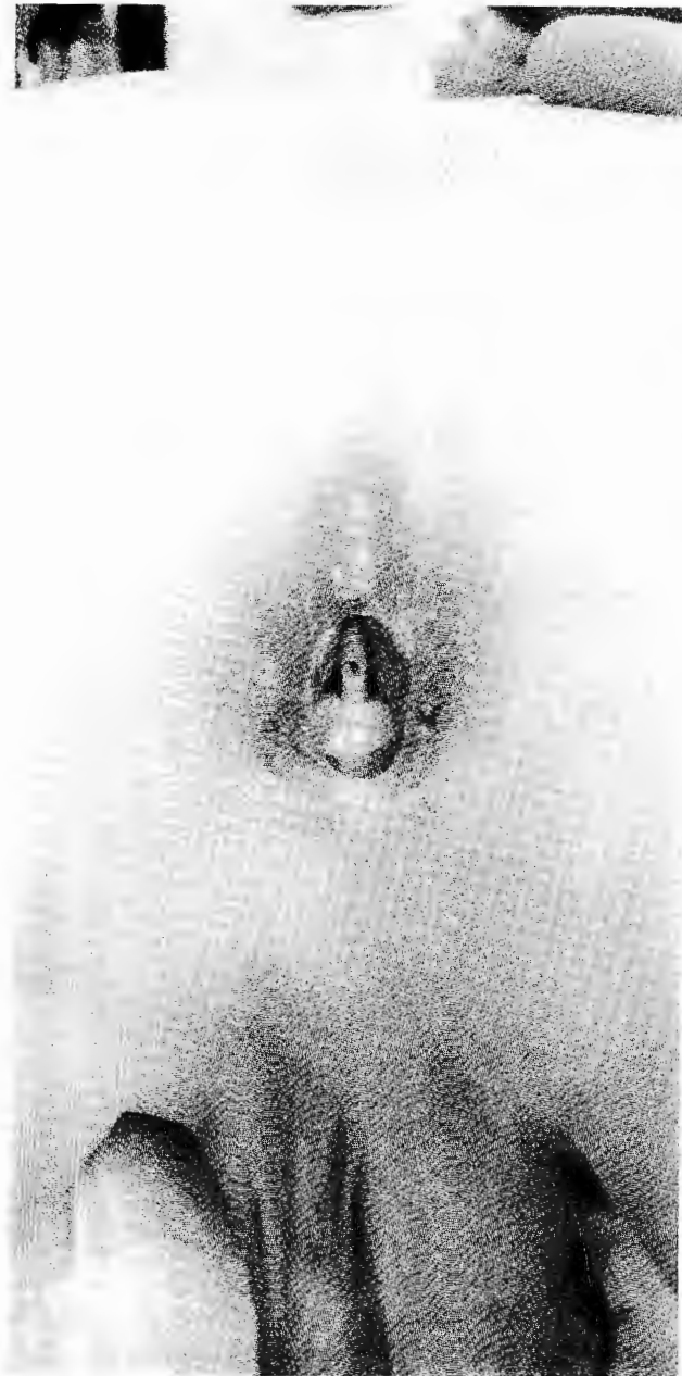
Figura 1 a. Aspecto pre y postquirúrgico de la región anal.

por planos, y se incidió el complejo muscular. Mediante electroestimulación se distinguieron las fibras musculares transversales de las sagitales y se determinó el área del ano anatómico.