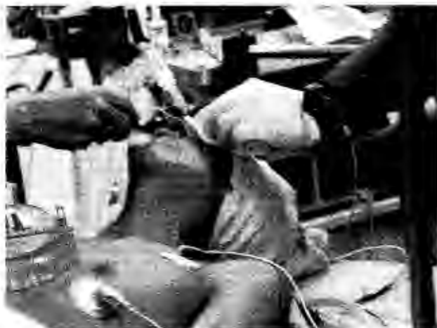
Figura 4. Momento de la intubación del paciente en el que ocurre equimosis y que aparentemente fue controlado.

taquicardia ventricular de 225x' que se observó en la pantalla del osciloscopio. Se suspendió con masaje carotídeo e hipotermia. Durante este evento el paciente tuvo hipercapnia y acidosis respiratoria así como bradicardia. Por este motivo se decidió reintubarlo, procedimiento doblemente complicado por las malformaciones bucofaríngeas y la manipulación previa que causó la presencia de coágulos, edema, secreciones (Figura 4). Después de la intubación se observó contenido hemático en los pulmones. En la Unidad de Terapia Intensiva se tomó un trazo de ECG que mostró bradicardia de 55x' y una radiografía de tórax en donde se veía una imagen radiopaca en el mediastino que confirmaba lo descrito en la endoscopia al momento de la reintubación. Una biometría hemática reveló leucocitosis de 14,300.