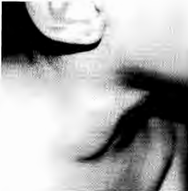
Figura 1. Dilatación cervical lateral derecha que aumenta con los esfuerzos.