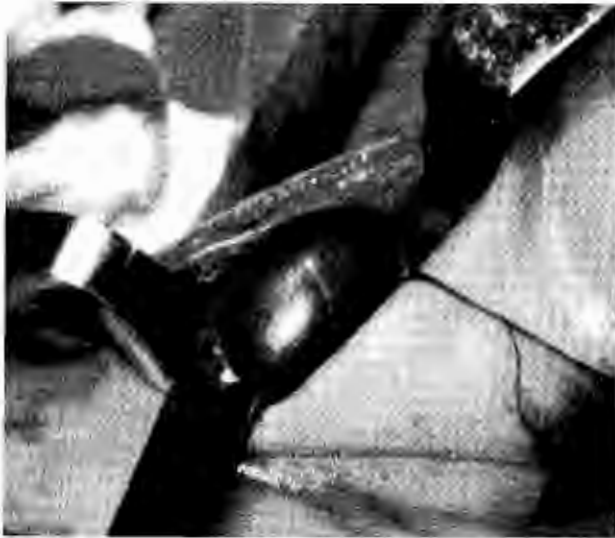
Figura 2. Fotografía transoperatoria que muestra la dilatación anormal de la vena yugular interna derecha.

mostraron aumento de volumen de los tejidos blandos. El ultrasonido reveló una masa quística en ese sitio. Un esófagograma fue normal. El diagnóstico inicial fue linfangioma quístico, pero se pensó en la posibilidad de una FVYI. Se decidió operar al paciente; se realizó una resección a la vena de 6 cm (Fig. 2). El