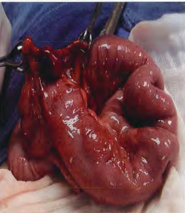
Figura 4. Disección ligadura del apéndice epiploico.