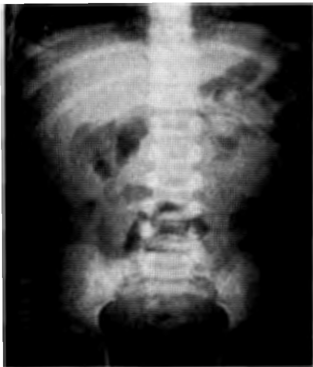
Figura 1. Radiografía simple de abdomen. Muestra escoliosis y borramiento del psoas.

Se realizó una laparotomía exploradora de urgencia; se halló una prolongación de grasa, pedunculada en el ciego