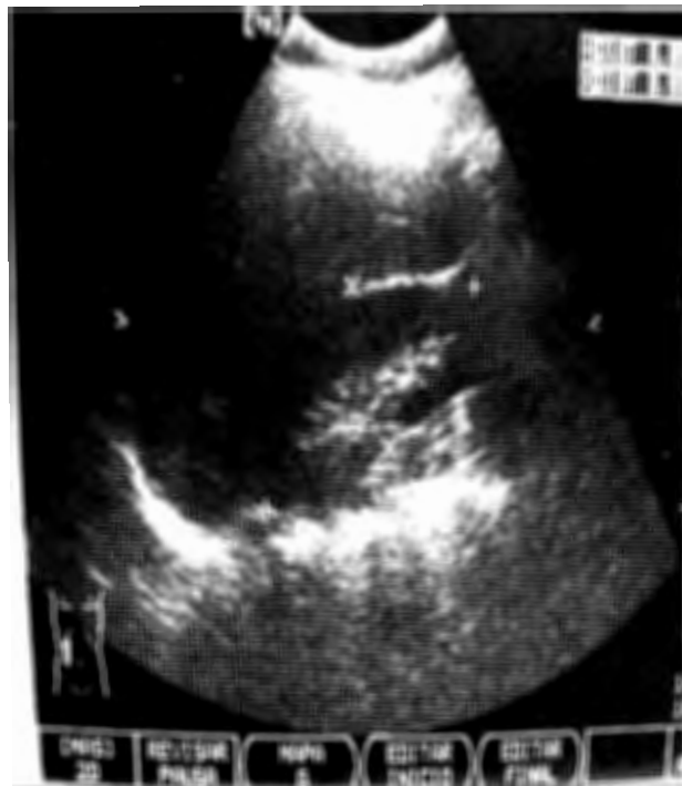
Figura 2. Ultrasonido abdominal de fosa iliaca derecha. Se observa líquido libre de aproximadamente 10 mL con hipomotilidad de íleo Terminal y abundante gas que no permite ver el apéndice cecal.

adherida a la serosa del colon, (Figura 3) 4 cm de largo y 2 cm de grosor aproximadamente, se disecó y se hizo ligadura de dicha prolongación. (Figura 4) Se hizo una apendicetomía profiláctica. (Figura 5)