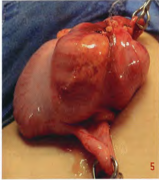
Figura 5. Apendicectomía.

Es una entidad infrecuente en niños. Se ve más entre la segunda y quinta décadas de la vida y es más frecuente en hombres (2:1). 6,9,12