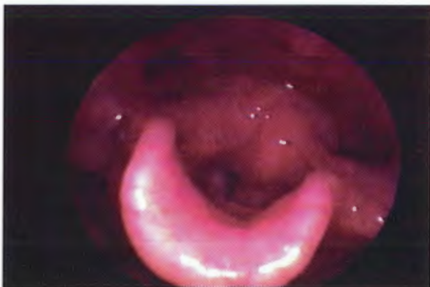
Figura 1. Región supraglótica que muestra edema e hiperemia de aritenoides.

7. La dieta del lactante es mayormente líquida, por lo que refluye con mayor facilidad.