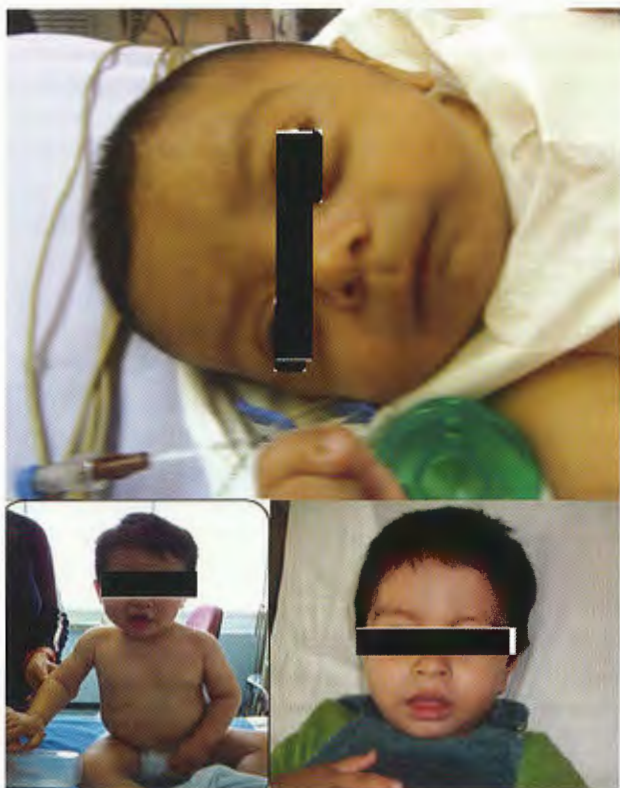
Figura 1. Paciente con colestasis. Su evolución después del procedimiento de Kasai.

cirrosis hepática y nunca hubo flujo biliar; la bilirrubina directa persistió alta. El seguimiento fue de cinco meses hasta 18 años de los pacientes que viven. No tuvieron complicaciones postoperatorias. Ningún caso tuvo que ser reoperado. El diagnóstico de los cuadros de colangitis se apoyó en la presencia de elevaciones térmicas, deterioro del estado general, aumento de la ictericia y de la bilirrubina directa; evacuaciones hipocólicas. Fueron tratados con antibióticos de amplio espectro tipo ceftriaxona. Sin embargo, en los primeros casos se prescribió trimetoprim-sulfametoxazol y los pacientes estuvieron hospitalizados varios días. La respuesta de los enfermos fue irregular y en cinco casos hubo que cambiar el antibiótico por ceftriaxona. Una paciente tuvo hepatitis B (Figura 2); otro paciente estuvo en coma por encefalitis viral. Un paciente falleció por perforación de esófago causada por esclerosis de varices. Las pruebas de función hepática son similares en todos los casos; se realizaron seguimientos con tomas cada seis meses dependiendo de la evolución de cada paciente. La fosfatasa alcalina siempre se mantuvo elevada