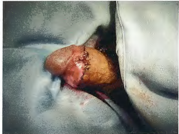
Figura 4. Pene posterior a la circuncisión, sin datos clínicos de malignidad.

orificio prepucial con la piel hipocrómica, cicatrizado e indurado, sin retracción del prepuce. Según Oster, la frecuencia de este problema es de 0.8 a 1.5% en jóvenes púberes. Este problema puede cursar con irritación local, sangrado del orificio del prepuce, disuria, retención aguda de orina, rara vez retención crónica o complicaciones de la vía urinaria superior. 2