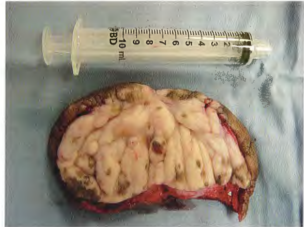
Figura 3. Prepuce redundante de 80 g.

El término “fimosis verdadera” fue acuñado por Gairdner, quien publicó un caso caracterizado por un